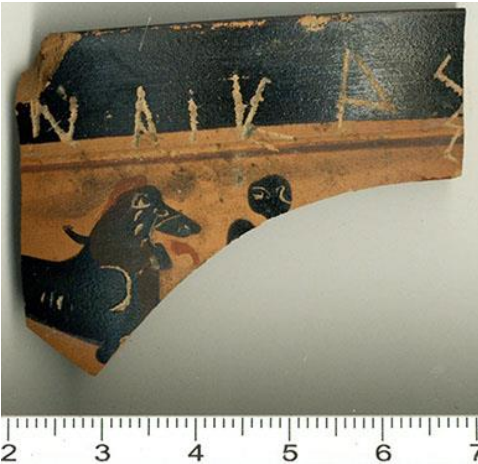
Рис. 2 Фрагмент с граффито ΝΑΙ ΚΛΑΣ.